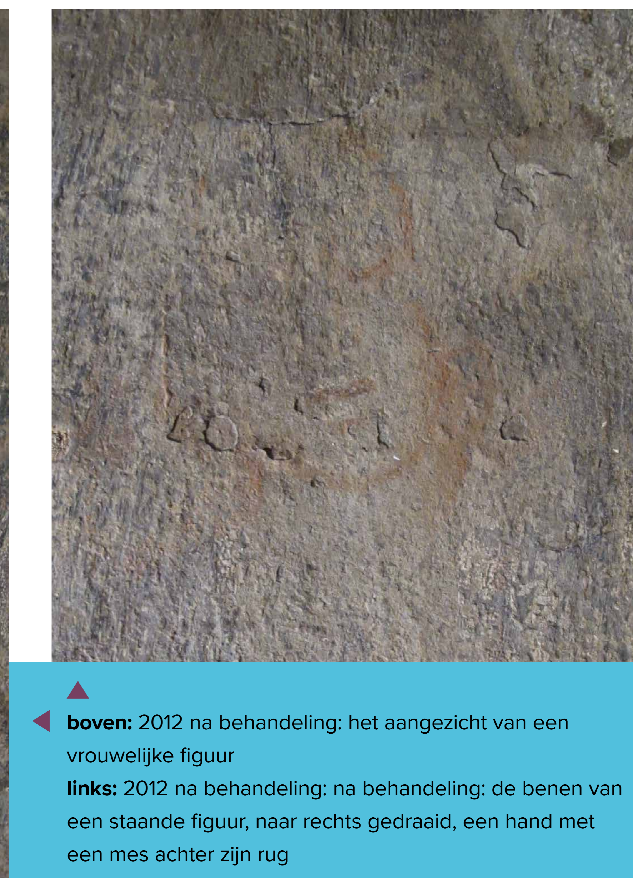
▲ boven: 2012 na behandeling: het aangezicht van een vrouwelijke figuur links: 2012 na behandeling: na behandeling: de benen van een staande figuur, naar rechts gedraaid, een hand met een mes achter zijn rug