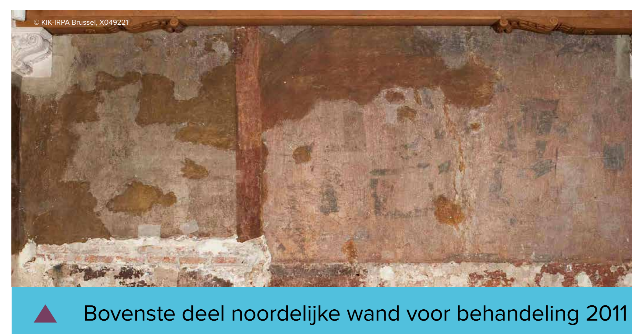
▲ Bovenste deel noordelijke wand voor behandeling 2011