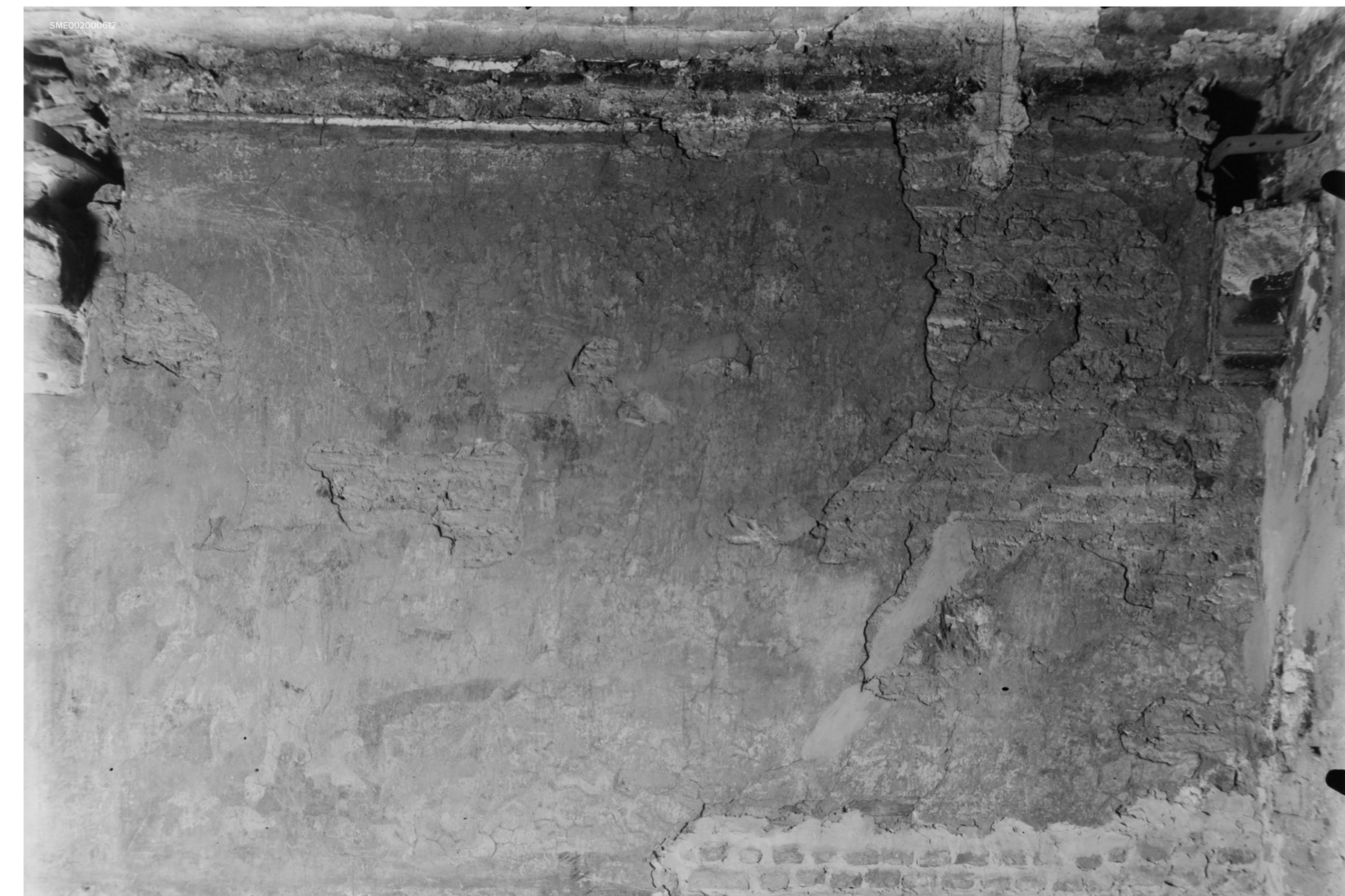
▲ Demades voor Dionysius, gehavende toestand in foto C. Joosen 1935

Gebaseerd op Ghisdal M. H en L. Van Dijk (2012). restauratiebundel "Hof van Busleyden te Mechelen: conservatie-restauratie van de muurschilderingen"