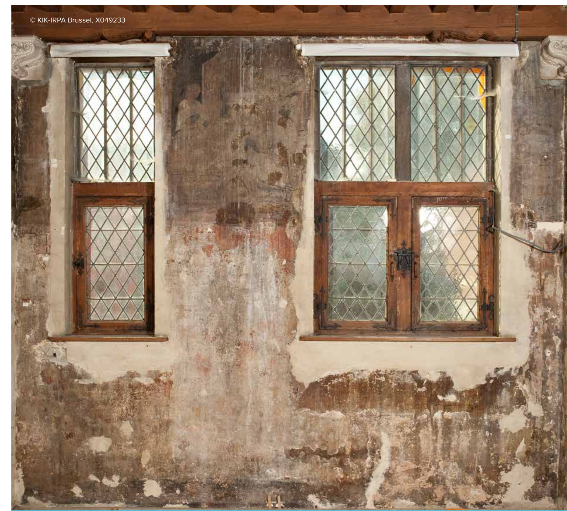
▲ Totaalbeeld zuidelijke wand voor behandeling 2011

De muurschildering op de noordelijke muur is zwaar gehavend. Geschreven bronnen geven aan dat de schildering de Romeinse veldheer Scaevola voorstelt. Rechts op het muurvlak is nog een restant merkbaar van de vuurvaas waarin deze veldheer zijn hand stak. Gedetailleerde foto-opnames geven ook nog de zeer verfijnde klederdracht van de soldaten weer.