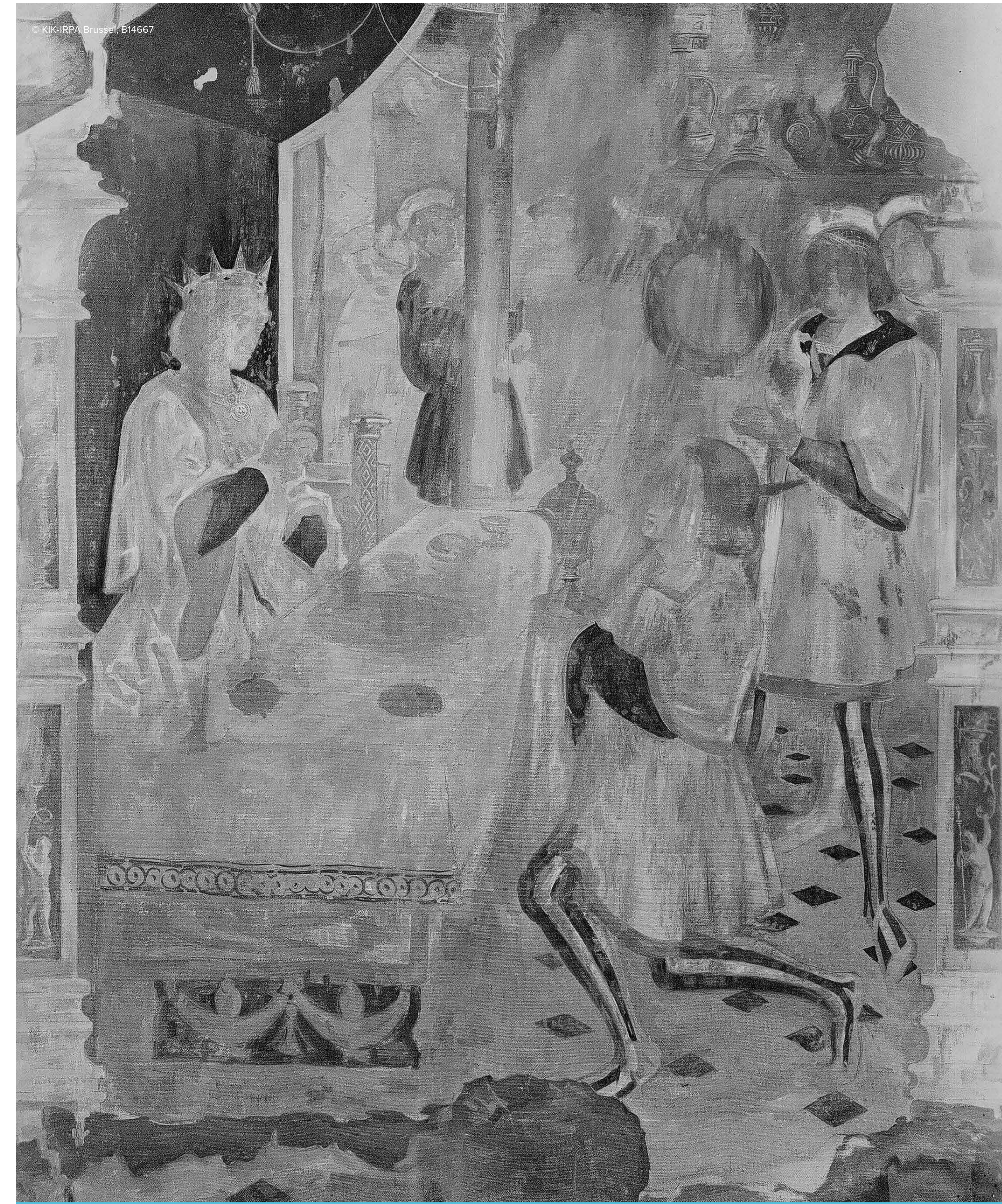
▲ vorst op troon, geschilderde kopie door Jan Verschueren, 1916