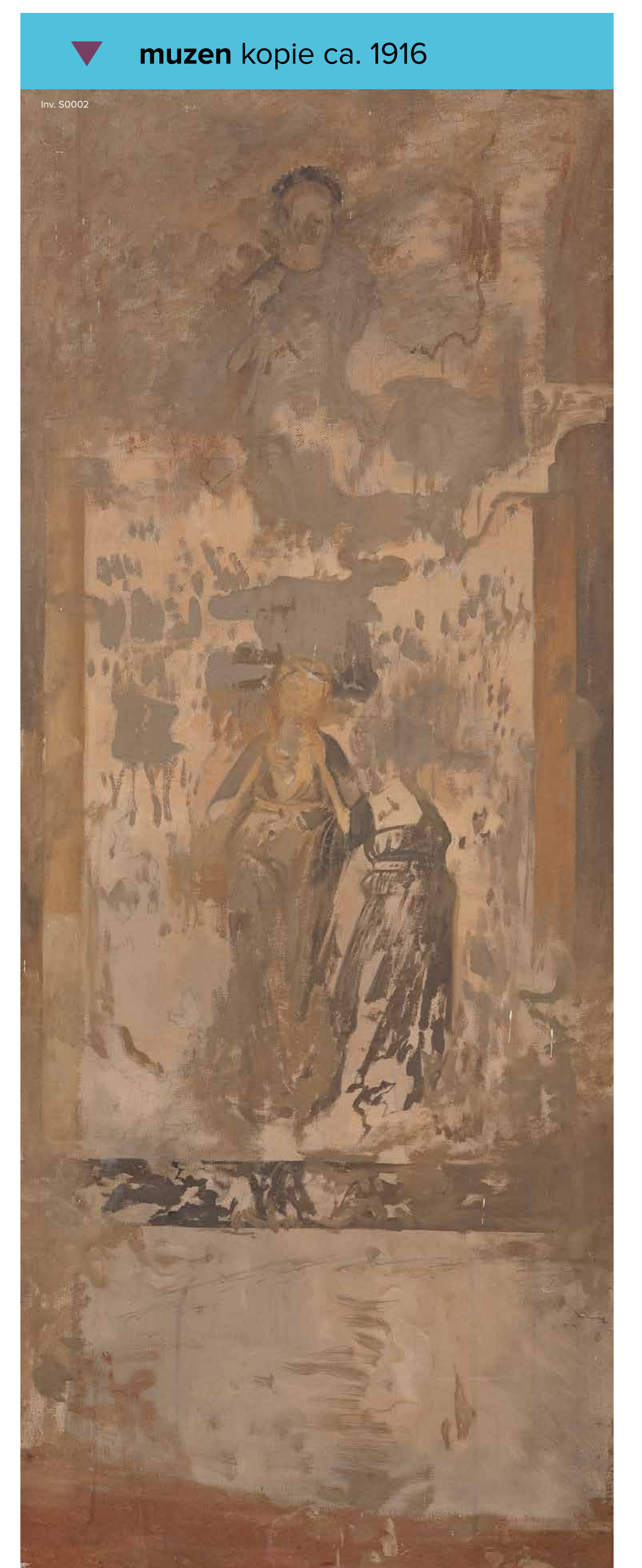
▼ muzen kopie ca. 1916