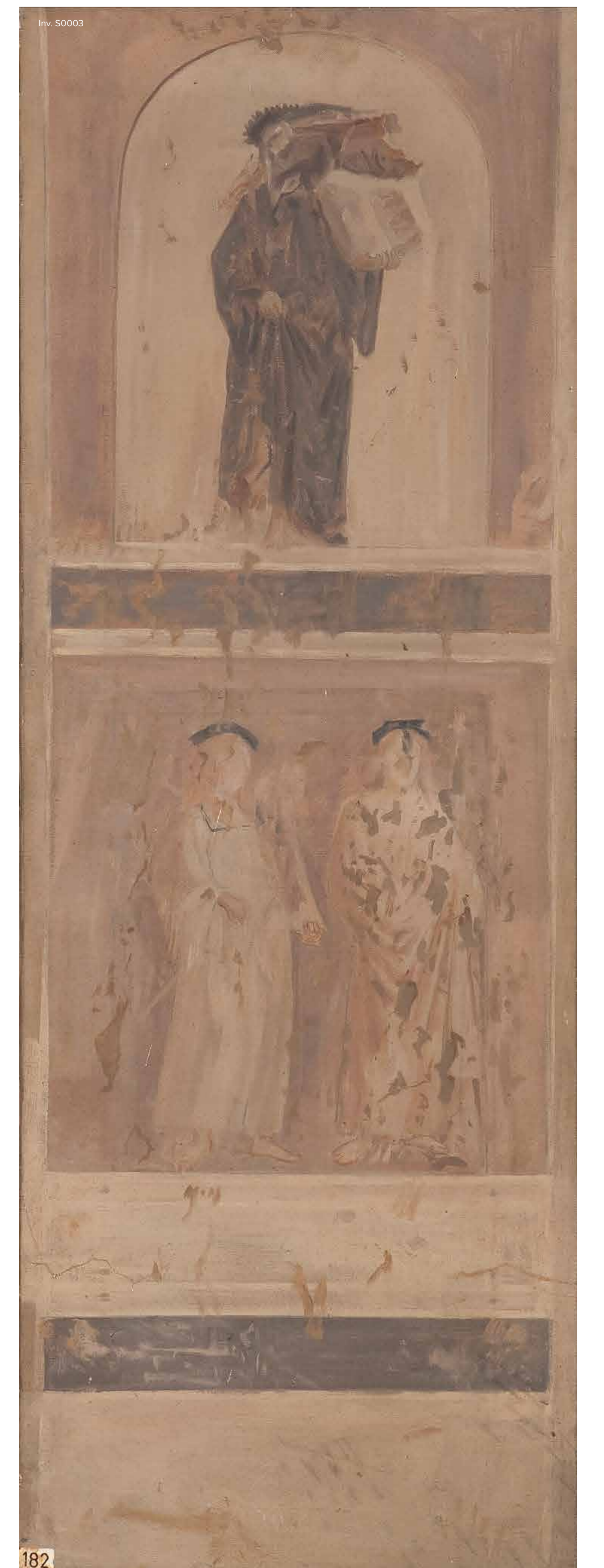
▲ muzen kopie ca. 1916