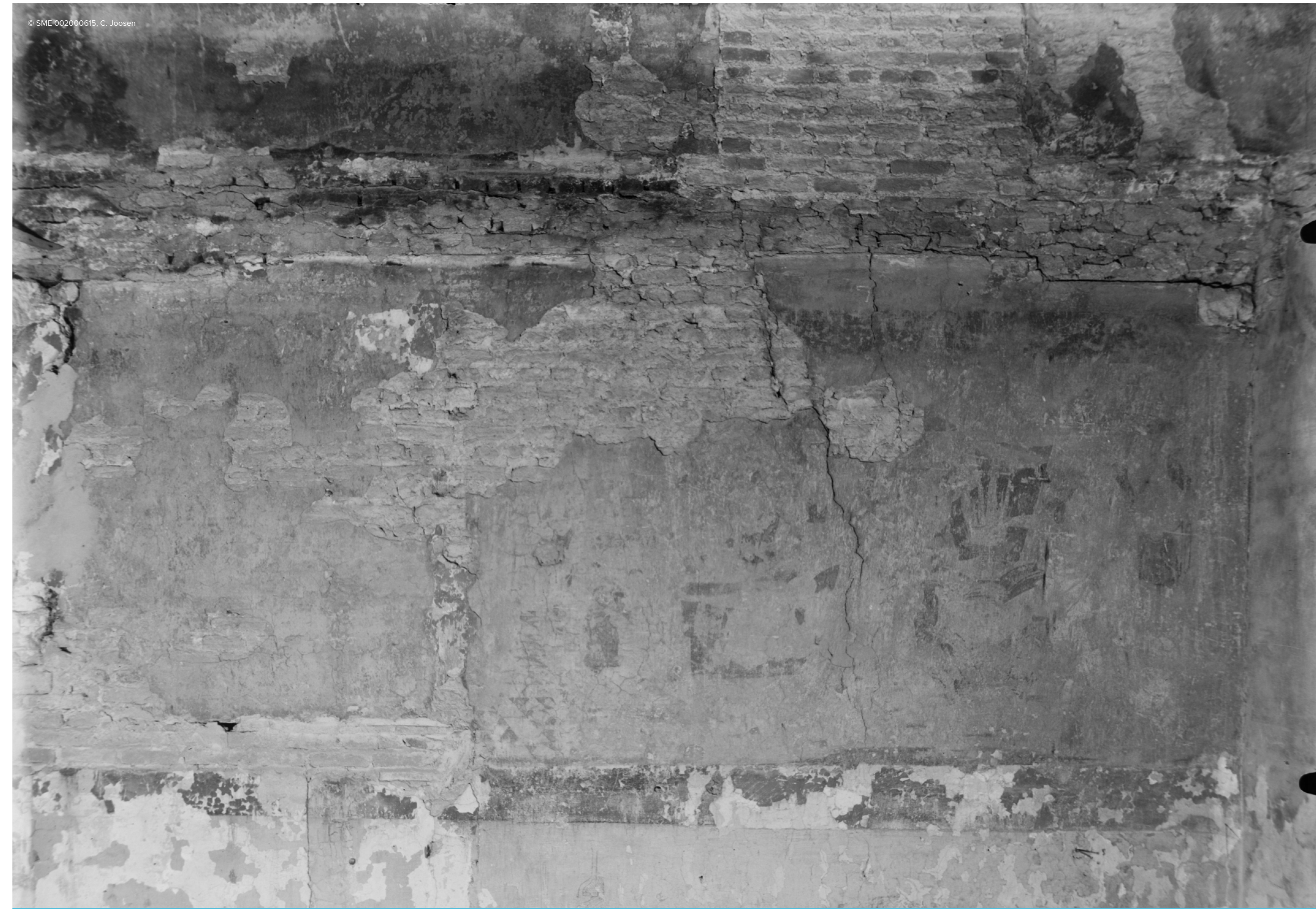
▲ Scaevola, foto C. Joosen 1935, rechts zijn de stralen van het vuur zichtbaar op een donkere achtergrond