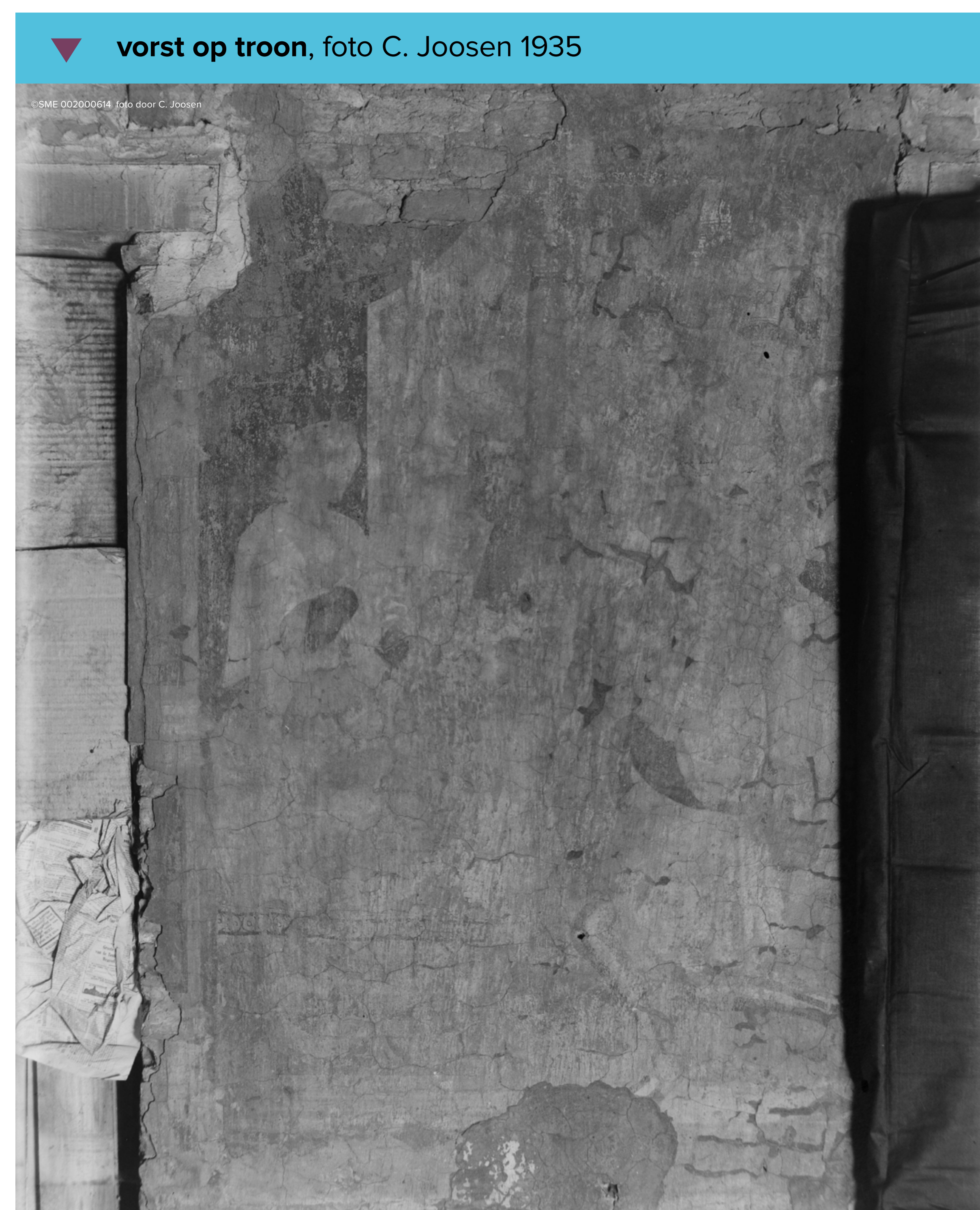
▼ vorst op troon, foto C. Joosen 1935