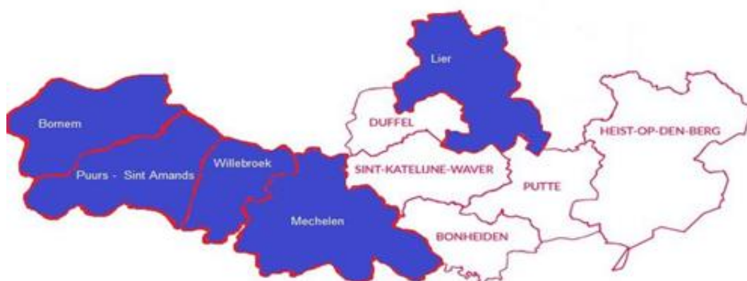
Figuur 1 Stand van zaken samenwerkingsovereenkomst VDAB in de regio Rivierenland (Februari 2022)