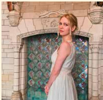
bobbiebeanss 2800love in het stadhuis van Mechelen #2800love