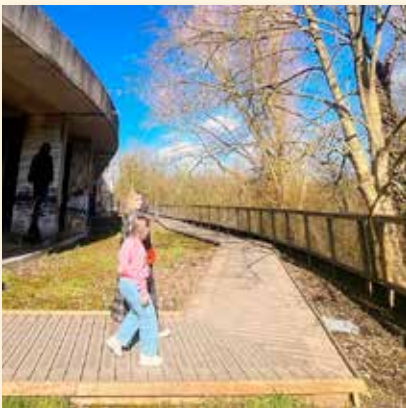
__vanessa.p__ Buiten = lievelingsplek #2800love #sundaykindalove #hotelruine #vrijbroekpark