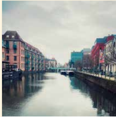
bee.through.her.looking.glass Deze prachtige stad associeer ik opnieuw met groei, veerkracht en liefde—voor mezelf. #zelfliefde #odeaandestad #2800love

Jouw kans om iedereen te laten meegenieten van jouw unieke kijk op Mechelen en zijn Mechelaars.