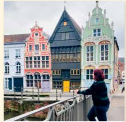
anneliess_xxo Greetings from Mechelen 🇧🇪 📷 #mechelen #2800love