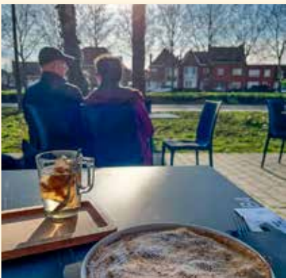
writingsbyamelie 🌻📷 Eindelijk terrasjesweer! Laat de lente maar beginnen! @beanice_mechelen #beanice #2800love