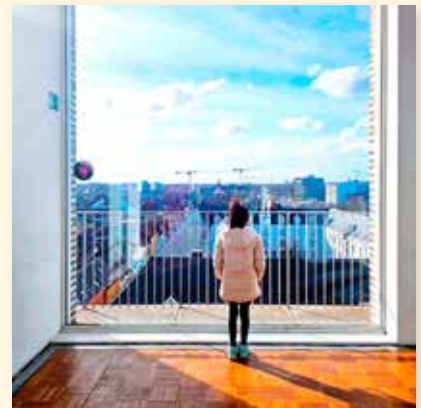
elbist4u Sometimes, photography isn't about capturing what is happening—but what might happen next. #framedbytime #2800love