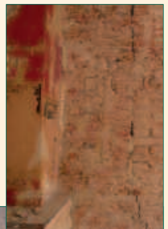
diverse dichtgemetselde muuropeningen