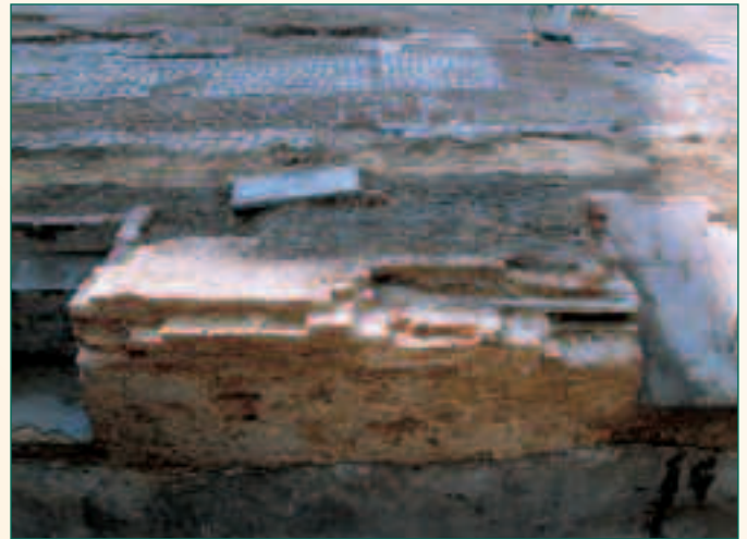
binnenzicht kelder Zakstraat 7 en (18de-eeuwse ?) koetsweg

Een stukje wegdek in grote zandstenen en met herstellingen in baksteen werd ontdekt onder de puinlaag afkomstig van de afbraak van het 13de-eeuwse gebouw. Vermoedelijk leidde een weg naar het huis. Andere resten van een wegdek werden teruggevonden bovenop de afgebroken muren van dit 13de-eeuwse huis. De juiste datering van deze weg is nog onduidelijk, misschien behoort hij bij de fase van de heropbouw van het huis.