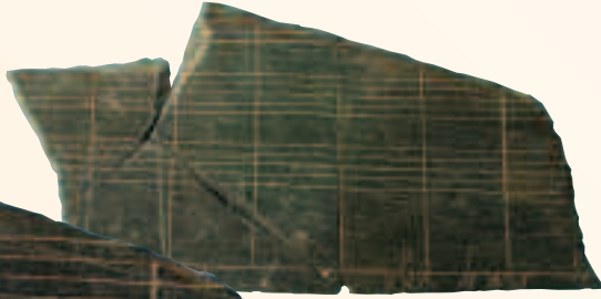
fragmenten leitjes met ingegrifte notenbalken

Uit de keldervulling kwam een opvallende en zeldzame vondst: vier samenhangende leisteenfragmentjes met daarin notenbalken gegrift. Muzieknoten staan er niet op, op één stuk zijn onderaan wel ingekraste letters zichtbaar.