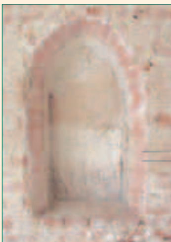
muurnis met baksteen imitatiebeschildering

Op de schuine rand van de nissen werd een baksteen imitatieschildering aangebracht. De zijkanten van de nis bleven op dat moment onbeschilderd. De vloer van de nissen is eveneens bepleisterd en wellicht in het rood geschilderd.