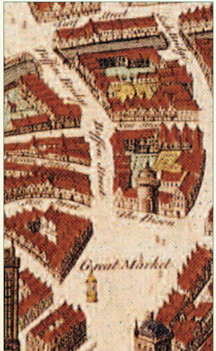
detail plan Basire (1745): Bofferbrug en loop van Melaan

Begin september werd de ploeg archeologen ook nog even teruggeroepen naar een plaats in het verlengde van hun vorige opgaving op de Veemarkt. Bij rioleringswerken in de Bofferstraat werden funderingen blootgegraven die hoorden bij de Bofferbrug. De Bofferbrug verbond de Bofferstraat met de Veemarkt en verderop met de Keizerstraat, ze vormde zodoende het bindmiddel tussen de uitvalsweg naar het oosten en het economische hart van de stad, de (Grote) Markt. Zij wordt voor de eerste maal vermeld in 1311.