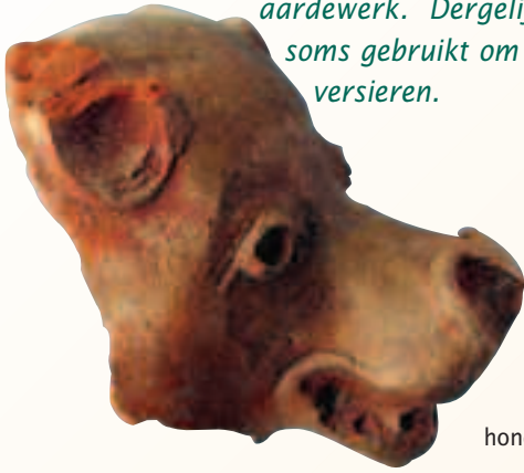
hondenkopje in rood aardewerk (nokversiering?)

Uit een latere periode dateert een hondenkopje in rood aardewerk. Dergelijke figuutjes werden soms gebruikt om de nok van het dak te versieren.