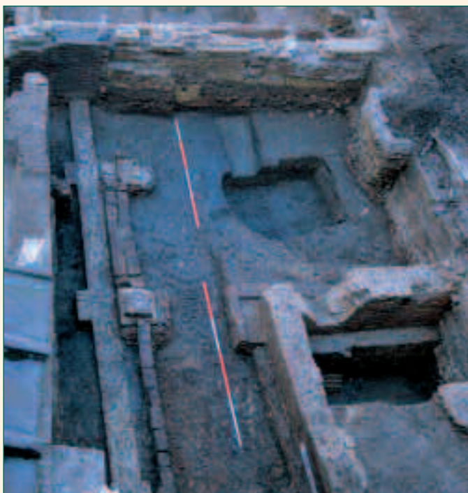
overzicht opgraving Zakstraat 7

Op het einde van de 13de eeuw werd dit pand letterlijk tot op de grond afgebroken, een dikke puinlaag bedekte de restanten ervan. Op de vloer bevond zich een laagje zwarte as, blijkbaar verwoestte een brand eerst het huis. Na de afbraak werd er, vermoedelijk nog in de 14de eeuw, een nieuwe constructie opgericht, ditmaal veel kleiner. Dikke bakstenen muren, eveneens aansluitend bij de achterzijde van het huis, rusten op zeer verzorgd gemetselde grondbogen. Het huis kent duidelijk een inkrimping van het woonoppervlak.