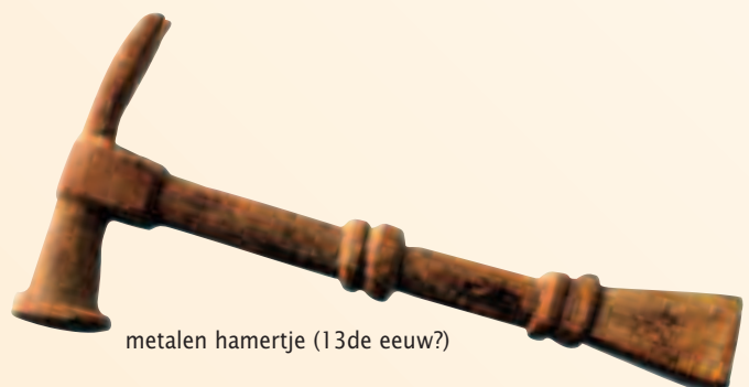
metalen hamertje (13de eeuw?)

Bij de oudste fase van Zakstraat 7, het 13de eeuwse gebouw, werd een klein hamertje teruggevonden in de vloer. Het werd reeds onder handen genomen door het restauratieatelier van het IAP en wacht nu op verder onderzoek.