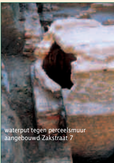
waterput tegen perceelsmuur aangebouwd Zakstraat 7

Op het erf van Zakstraat 7 werd een waterput blootgelegd die dateert uit de 14de eeuw. Hij werd, samen met de huismuren, aangelegd op grondbogen en de perceelsmuur. Opvallend is wel de vreemde positie van de waterput tegen deze