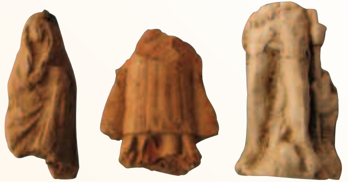
fragmenten beeldjes in aardewerk

Uit dezelfde keldervulling werden drie beeldjes bovengenoemd, in aardewerk en pijsaarde. Mogelijk gaat het om een priesterfiguur, een afbeelding van St.-Joris met de draak en een nog ongeïdentificeerd beeldje. Zij horen waarschijnlijk in de 16de eeuw thuis.