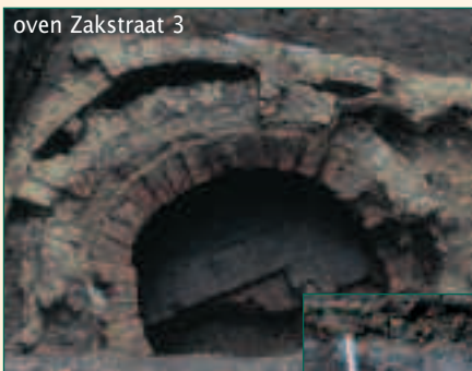
oven Zakstraat 3

Op dit terrein werden - naast twee kelders waarvan de ene kan gedateerd worden in de 16de eeuw - 3 waterputten en een oven teruggevonden.