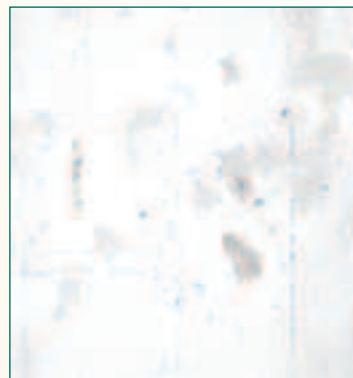
detail deurtje in nis

Op de nieuwe witte kalklaag van de achterwand werden deurtjes in trompe-l'oeil geschilderd: halfronde vorm, verticale planken, scharnieren en een slot. Het slot bevindt zich soms rechts en soms links. De overblijvende boord rond de deuren is lichtroze van kleur.