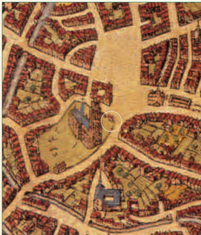
detail gravure G. Braun & F. Hogenberg (1581)

De heraanleg van het plein voor de St-Rombouts-kathedraal betekende voor de archeologen een leuk intermezzo. De opgraving in de Zakstraat werd in de loop van de maand augustus even stilgelegd en twee weken lang werd dit stukje Mechelen samen met stagiairs van de Leuvense universiteit onderzocht. Er moest niet eens diep gegraven worden voor de resten van twee huizen vrijkwamen. Op een kaart naar Jan Van Hanswijck (1576) kan men zien hoe deze huizen er ooit uitzagen. Het waren in ieder geval geen huisjes van eenvoudige lieden.