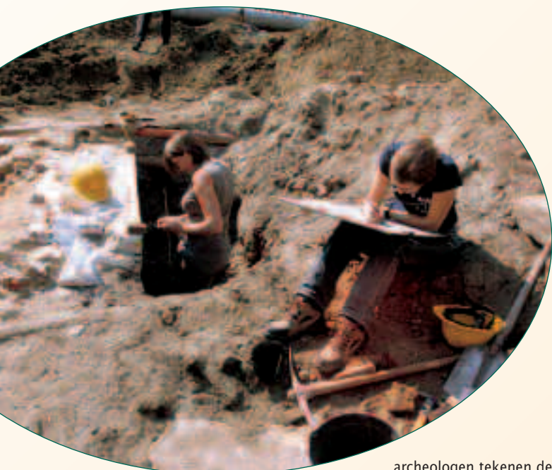
archeologen tekenen de sporen van de Beverbrug op

Twee dwarse bakstenen muren verankerden dit bruggenhoofd in de oever van de Melaan.