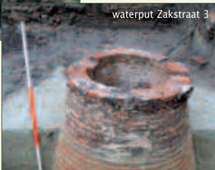
waterput Zakstraat 3

De grootste waterput, die nog niet gedateerd werd, was zeer verzorgd gebouwd in baksteen. In de aanleg zijn twee fases te onderscheiden.