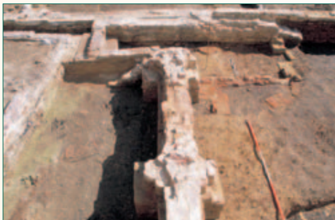
dubbelzijdige gotische haard

De bedoeling van de hele constructie is nog onduidelijk. In de loop van de 15 de eeuw wordt het huis versmald en wordt er waarschijnlijk een wegje naast het huis aangelegd. Boven op één van de dwarsmuren wordt er ook een grote dubbele haard gebouwd (plan: roze, haard).