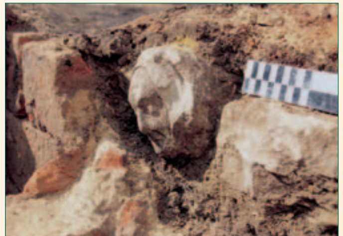
haardwang met hoofdje

Waar het hoofdje oorspronkelijk vandaan komt, is niet geweten.