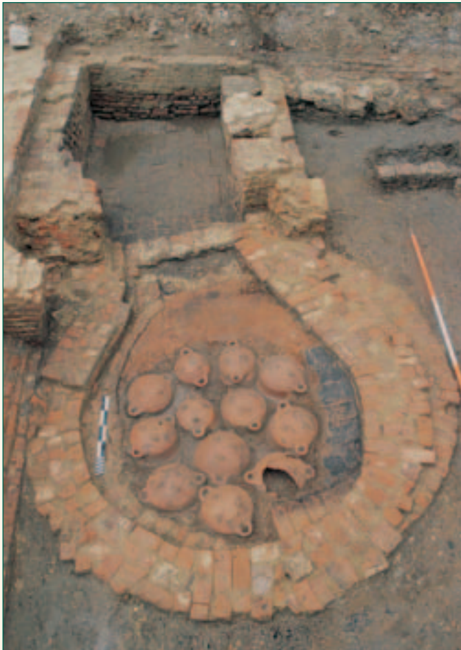
twaalf potten onder hardvloer

Bij het verwijderen van de tegelvloer kwamen 12 kommen in rood aardewerk aan het licht, alle van dezelfde vorm maar met licht verschillende afmetingen.