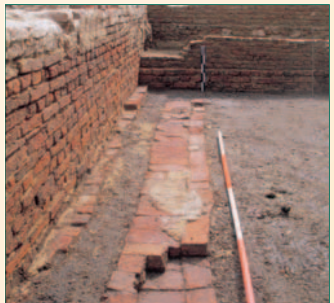
muur zichtbaar in het grondvlak

Het oudste niveau dat de archeologen bereikten, bestond uit een zwart pakket zand waarin zich veel organisch materiaal bevond. Hetzelfde pakket ging trouwens ook het 13 de -eeuwse houten huis aan de Bafferstraat vooraf maar dit kon wegens tijdsgebrek nauwelijks onderzocht worden. Boven op dit zwarte pakket werd in de 13 de eeuw in de Zakstraat een huis aangelegd met een vloer in zandige leem. De afmetingen van het huis kunnen niet gereconstrueerd worden omdat vele verbouwingen slechts één muur gedeeltelijk spaarden (plan: lichtblauw, muur).