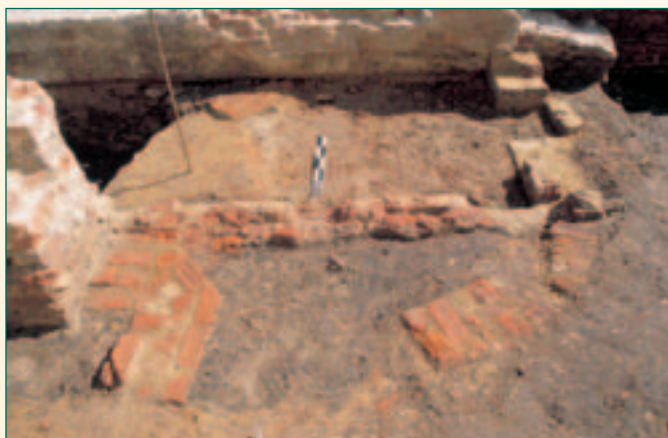
resten van oven

Hier bleef echter niet veel van over (plan: geel, resten van oven).