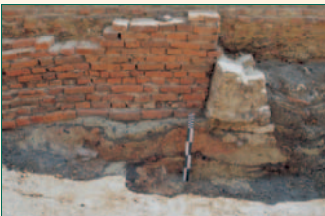
lagen verbrande leem onder pijler

De opvallendste ontdekking van de tweede campagne was het spoor van een 13 de -eeuws gebouw dat opgetrokken was in hout. Gezien de dikke lagen verbrande leem die we terugvonden, was het vermoedelijk gebouwd in vakwerk. Bij vakwerkbouw wordt de ruimte tussen de balken opgevuld met leem. Nadat dit gebouw met de grond gelijk gemaakt werd, werd het vervangen door een gelijkaardige constructie, dit keer gefundeerd op zandstenen pijlers.