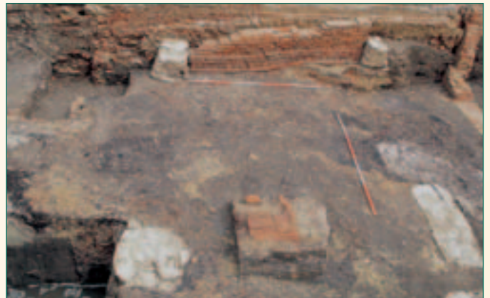
zicht op vier van de zandstenen pijlers met achteraan sporen van de versteningsfase

De houtbouwfase werd gevolgd door een bakstenen versie van hetzelfde gebouw, waarbij de vroegere zandstenen pijlers herbouwd werden en als fundering dienden (plan: lichtblauw, de versteningsfase; pijler onderaan links is de hoekpijler).