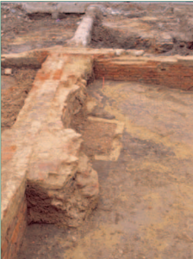
één van beide haarden

In de loop van de 15 de eeuw werd het huis smaller (waarschijnlijk werd een smalle weg naast het huis aangelegd) en werd de grootste ruimte voorzien van een bakstenen vloer in visgraatmotief. Twee enorme gotische haarden domineerden het vertrek. (plan: roze, 15 de -eeuwse muur en twee haarden).