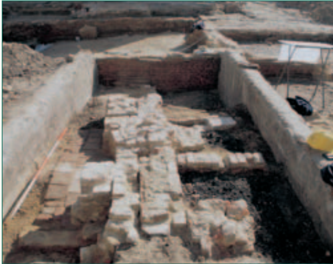
haard gebruikt voor metaalbewerking

De kant van de Reuzenstraat werd slechts vluchtig onderzocht, deels wegens tijdsgebrek en deels wegens de zware recente verstoringen. Enkele haarden, waarvan eentje met verschillende lagen smeltafval van metaal, een beerput en een keldertje kunnen hier nog vermeld worden.