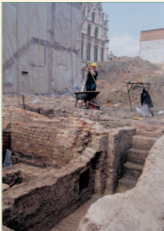
kelder en trap

Wellicht in dezelfde periode werd een keldertje met rechthoekige nissen in het huis gestoken, waarvan een gedeelte achteraf weer werd opgevuld met een trap die de halve ruimte in beslag nam (plan: grijs, kelder en trap).