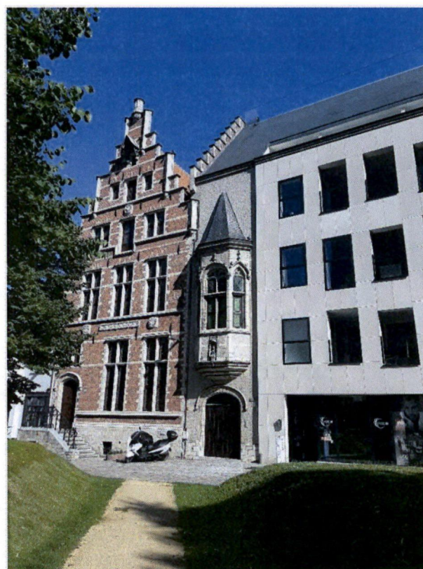
Foto 3: Algemeen zicht erker en huis Concordia van op het Sint-Romboutskerkhof (28 juni 2022)