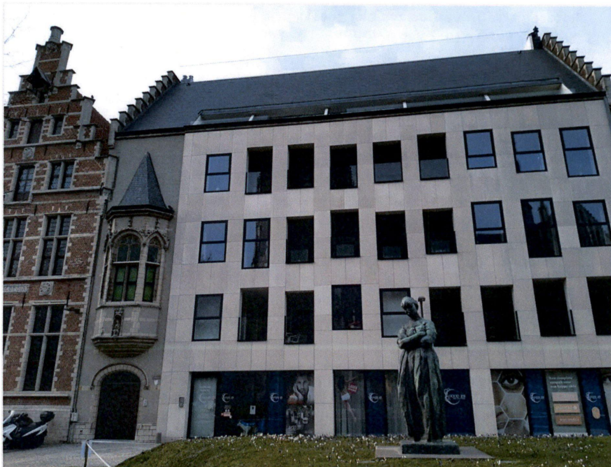
Foto 1: Algemeen beeld van de erker en het naastgelegen kantoorgebouw (17 maart 2022)