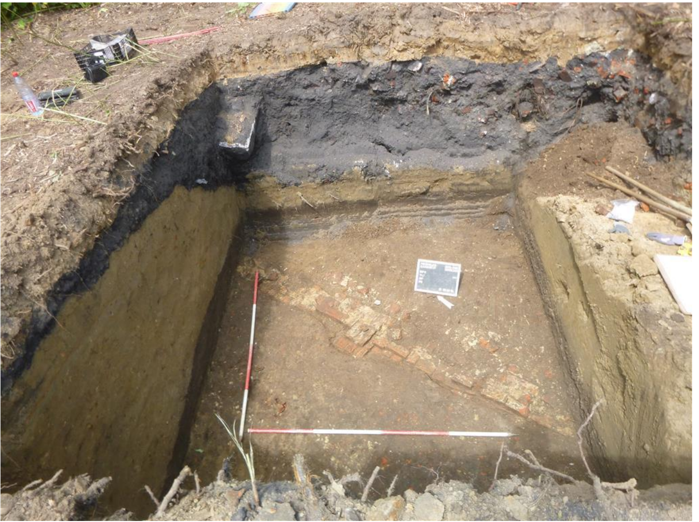
Een van de aangetroffen muren tijdens het vooronderzoek